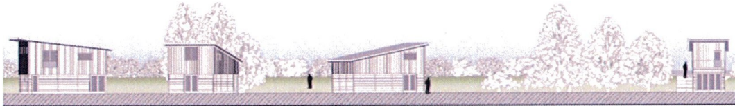
Afbeelding: nieuwe situatie aanzicht nieuwbouw vanuit het park