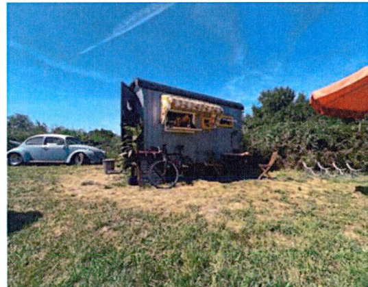
Afbeeldingen: projectlocatie huidige situatie kiosk