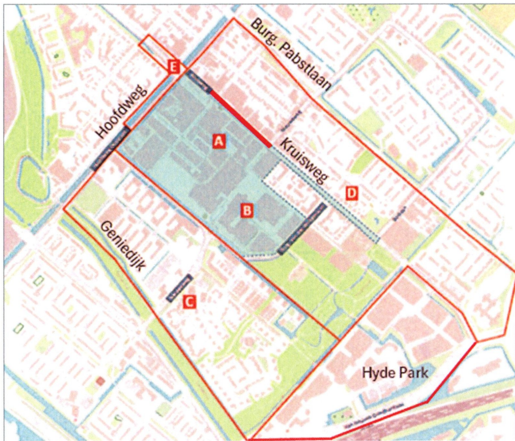
Figuur 1: A-tarief Stadscentrum in gebieden A-B-C-D-E en Hyde Park (inclusief Stationsgebied). De Kruisweg hoort hier niet bij en behoudt het Shop en Go tarief. In blauw aangegeven het AB gebied (zie ad d)).